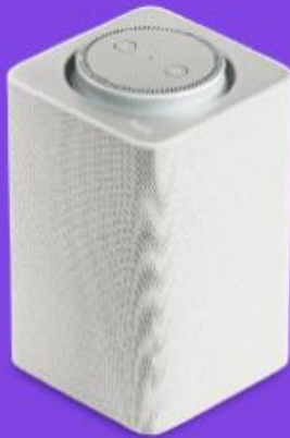
Умная колонка Яндекс.Станция