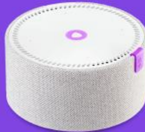
Умная колонка Яндекс.Станция Мини